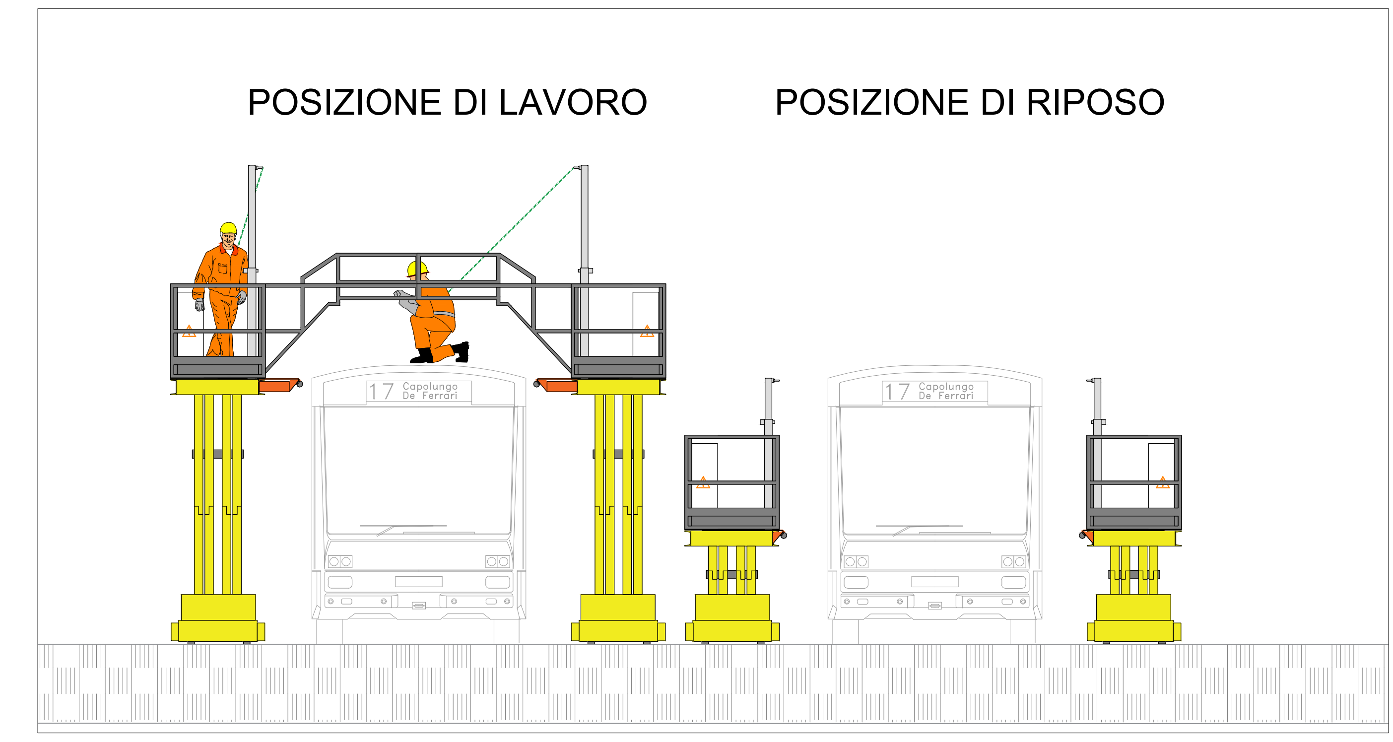
TIPOLOGICO PASSERELLA MOBILE A BATTERIA