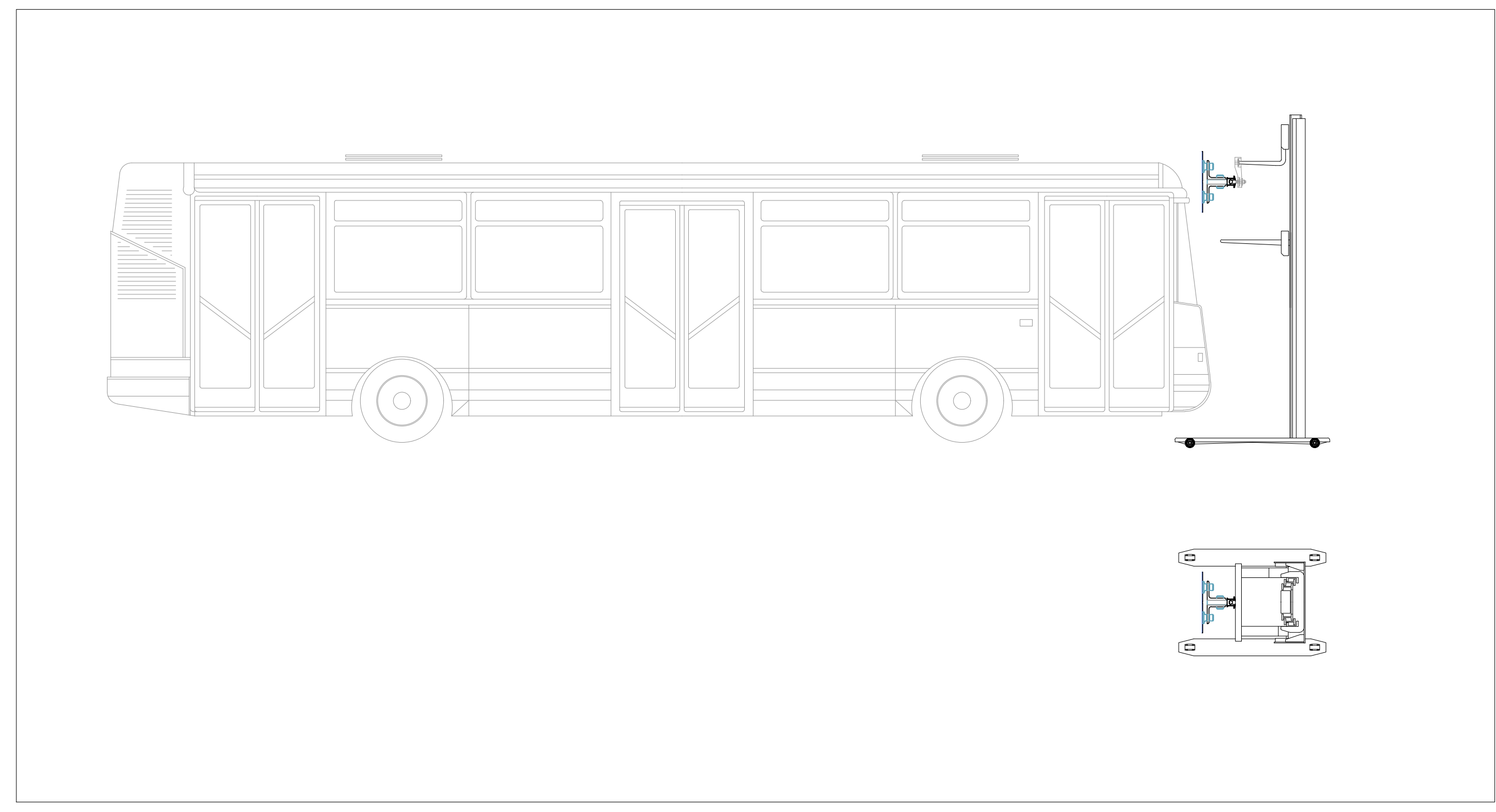
TIPOLOGICO CARRELLO SOLLEVATORE CON VENTOSE PER CRISTALLI